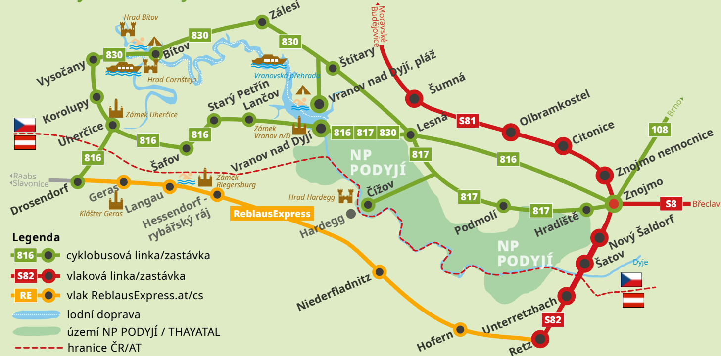
Schéma cyklobusů IDS JMK

Jízdenky IDS JMK platí také ve vlacích včetně jízdy do Retzu, neplatí na lodní dopravě po Vranovské přehradě a v ReblausExpressu.